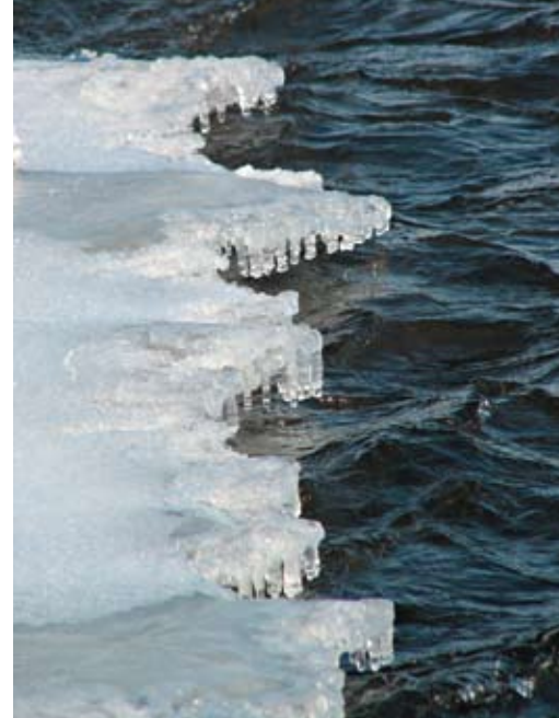
Le fait que l'eau des lacs gèle quelques semaines plus tard à l'automne et dégèle quelques semaines plus tôt au printemps prolonge la période sans glace.

La température est un facteur qui agit non pas de façon limitative sur la croissance des algues, mais plutôt sur sa rapidité. En effet, elles sont capables de se développer en eau froide, près du point de congélation, alors qu'elles croissent également dans les couches d'eau chaude d'un lac qui peuvent atteindre 30 °C. Dans les faits, l'augmentation de la température de l'eau active le métabolisme des organismes aquatiques. Lorsque la température